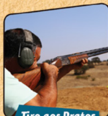
Tiro aos Pratos